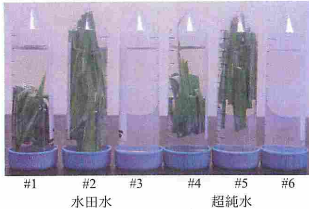
図 1. 組換えイネ茎葉の浸せき処理